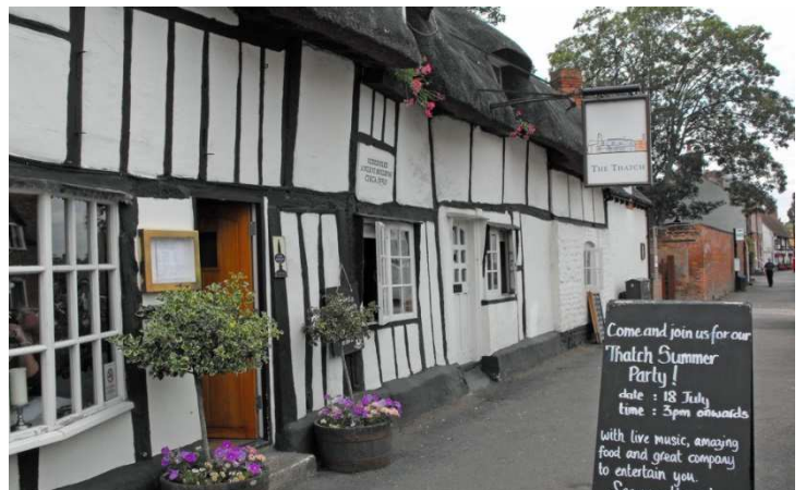
Thame alias "Causton",